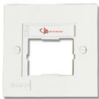
CTE2-FP-(XX)..... Placa frontal sencilla británica para un acoplador

Las placas frontales CT británicas son compatibles con las normas de Gran Bretaña (85 mm x 85 mm) y están diseñadas para su total compatibilidad con los acopladores CT.