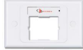
CT2-FP-XX)..... Placa frontal sencilla para un acoplador