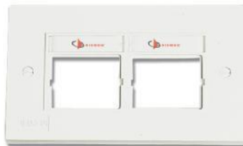
CTE4-FP-(XX)..... Placa frontal doble británica para cuatro acopladores

Use (XX) to specify color: 02 = white, 82 = alpine white