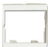
CTE-45-(XX)..... Adaptador 45 mm x 45 mm para un acoplador