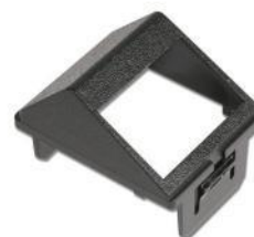
CTE-HZA-02-(XX) ..... Adaptador horizontal angulado CT para dos módulos MAX, Z-MAX o TERA