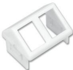
CTE-MXA-02-(XX) ..... Adaptador angulado CT para dos módulos MAX, Z- MAX o TERA