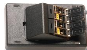
Use (XX) para especificar color: 01 = negro, 02 = blanco

Use (XX) para especificar color: 02 = blanco, 20 = marfil