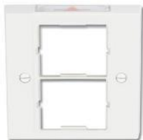
CTE4-FP22-(XX)..... Placa frontal sencilla británica para dos acopladores