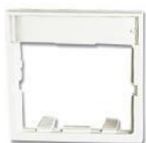
CTE-A-(XX)..... Adaptador 50 mm x 50 mm para un acoplador