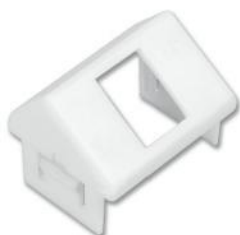
CTE-MXA-01-(XX) ..... Adaptador angulado CT para un módulo MAX, Z- MAX o TERA